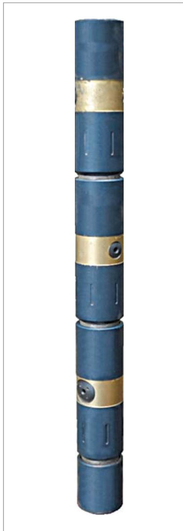
Рис. 1. Оборудование для гидромониторного воздействия ГМ-88 «Москит»

кой скорости закачки химических реагентов непосредственно в интервалах перфорации скважин. Сгенерированные волновые пульсации влияют на свойства системы «продуктивный пласт – пластовый флюид».